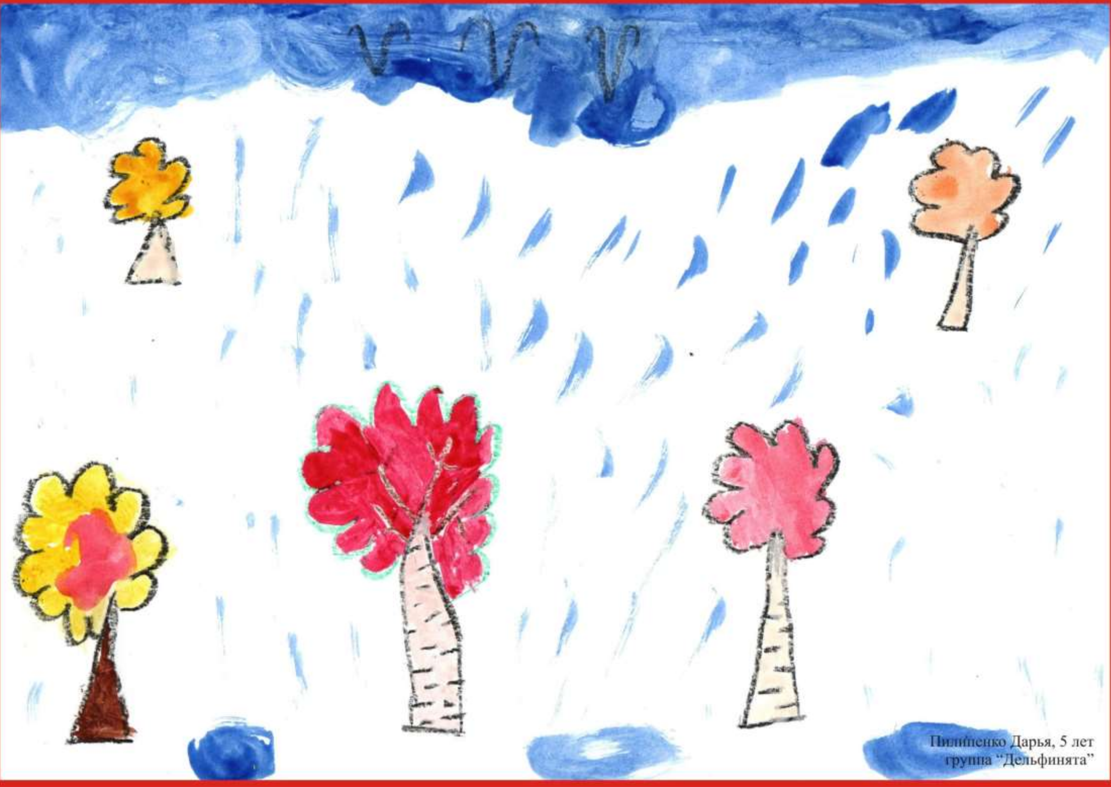
Пилипенко Дарья, 5 лет группа "Дельфинята"