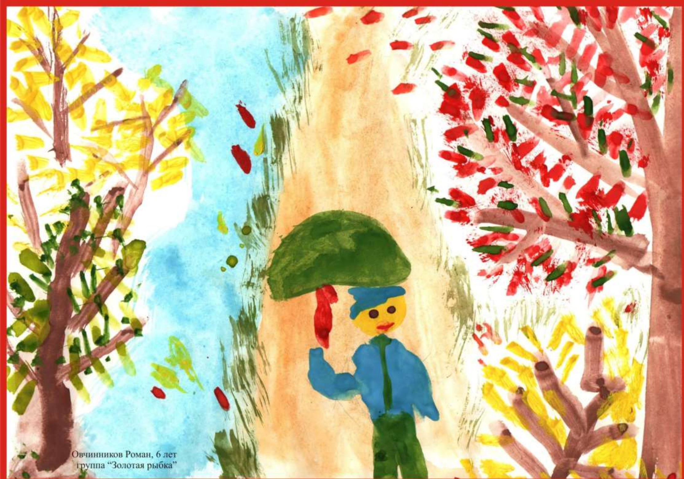
Овчинников Роман, 6 лет группа "Золотая рыбка"